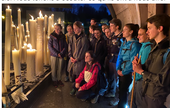
Dépôt du cierge de l'établissement par le « commando » qui a effectué la marche de nuit en partant de la Grotte à 21 h pour arriver à l'Immaculée vers 7H30