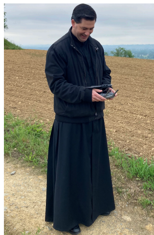
Le Père Damien a mis un point d'honneur à rejoindre le groupe pour le filmer à l'aide d'un drone qu'il maîtrise à la perfection.