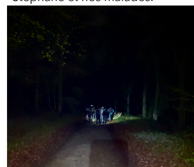
Cette marche nocturne, dans les bois, à la frontale, marque les jeunes par son atmosphère et les moins jeunes par son exigence... excellent pour entrer dans le Triduum !