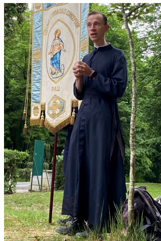
L'abbé Roy au départ de la marche a fait chanter un Je Vous salue et la prière de Saint Ignace de Loyola adressée au Seigneur.