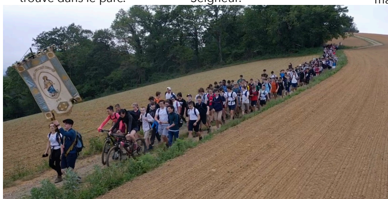
Cette belle troupe a, nous l'espérons, sans doute réjoui tous ces prêtres, ces professeurs et ces élèves qui nous ont précédés depuis plus d'un siècle. Nous tenons à écouter ce qu'ils ont à nous dire.