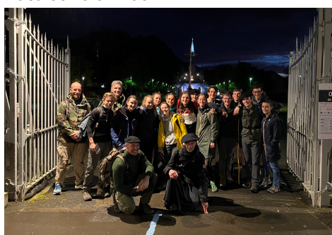
Le départ : tout le monde sourit, pour l'instant... c'est un peu comme les classes à Saint-Cyr sauf que c'est plus dur !